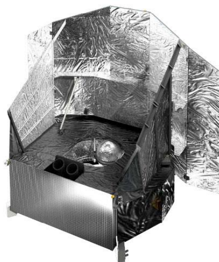
Service Module (SVM)