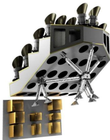
Payload Module (PLM)